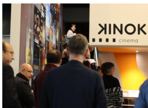
Les membres avant la séance de cinéma

Parfaitement organisée et passionnante, la conférence annuelle à Saint-Gall a une fois de plus permis aux membres d'avoir des échanges professionnels et personnels enrichissants et restera un excellent souvenir pour tous.