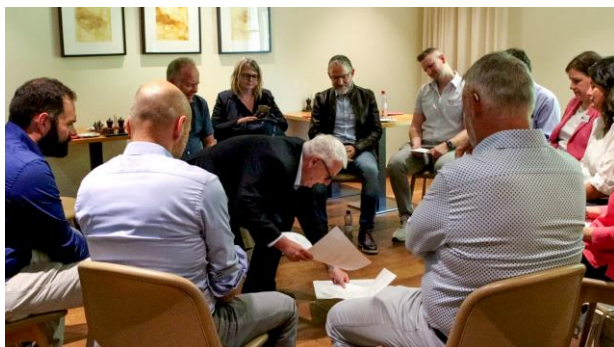
Les membres échangent leurs points de vue sur différentes questions liées au thème principal